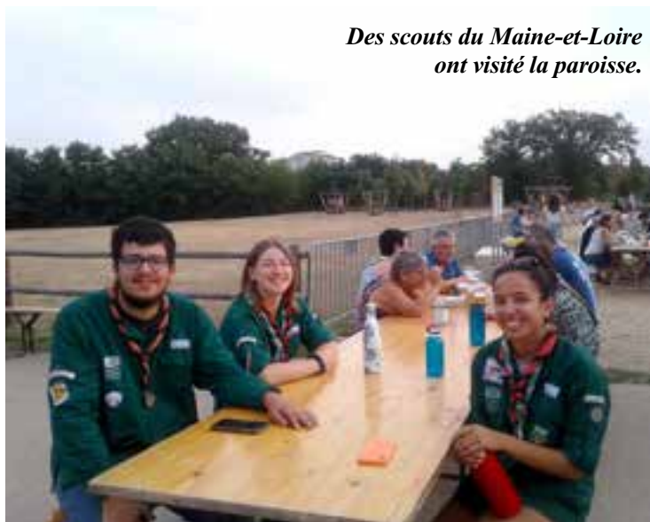
Des scouts du Maine-et-Loire ont visité la paroisse.