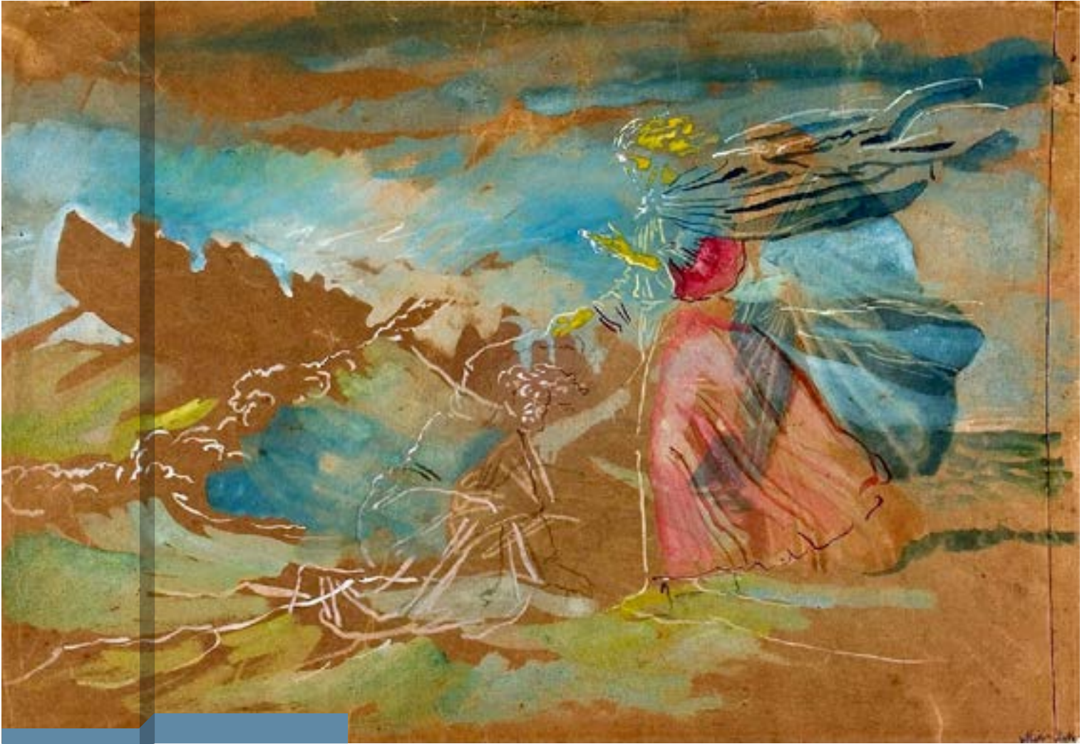
Jésus marchant sur les eaux, Alexander Ivanov.