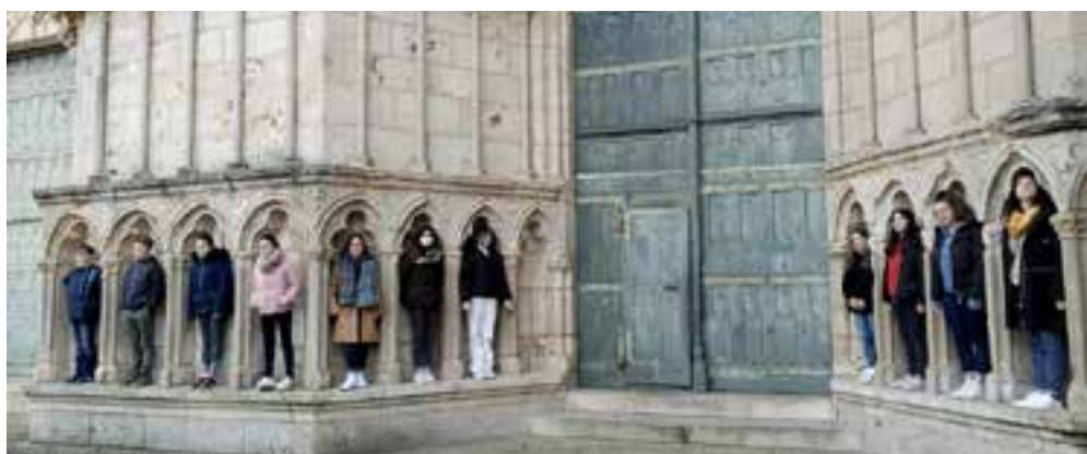
Les confirmands en visite à la cathédrale de Poitiers.