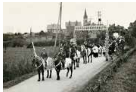
La mission à Loublande en 1929.

La création des communautés locales dans notre diocèse manifeste bien "l'Église là où elle vit"!